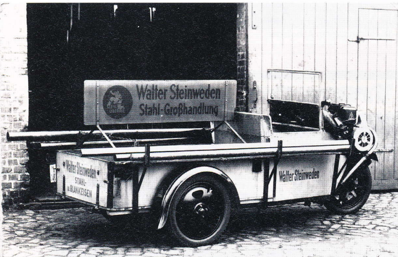
Ein Bild aus dem Jahr 1929.

„Entsprechend investieren wir gezielt weiter in diesem Bereich – auch zum Nutzen unserer Kunden. Das Feedback ist bislang sehr positiv und bestärkt uns darin, den vor fast 90 Jahren eingeschlagenen Weg als Blankstahl-Spezialist und „Problemlöser“ für Bedarfsgpässe weiter fortzusetzen.“