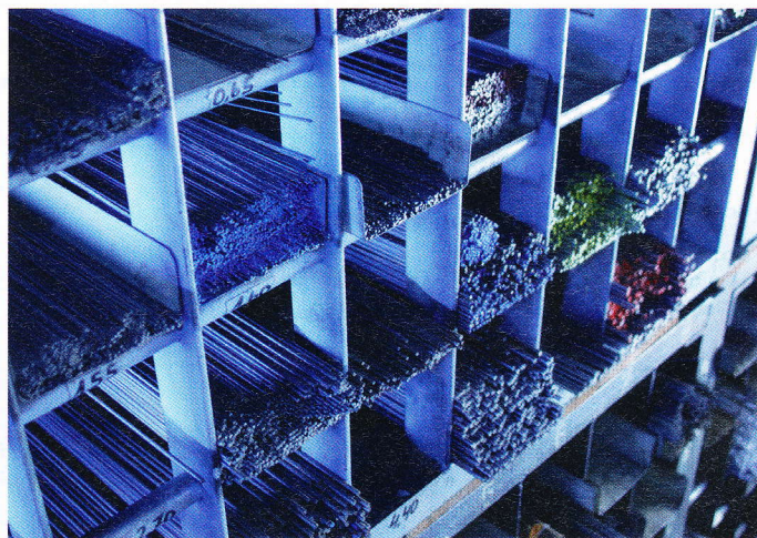
Ein Blick in einen Teil des Lagers

bandproduktion bei Ford und anderen Automobilherstellern machte Walter Steinweden klar, dass Lagerhaltung nicht nur Kapitalbindung bedeutet, sondern zugleich auch ein unschlagbarer Er-